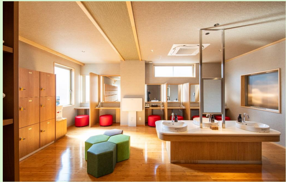
【女性脱衣所】 ドライヤーにもこだわったパウダールーム