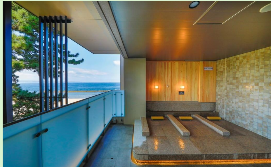
【女性大浴場】「淡月の湯」 寝湯で体の芯から温まります